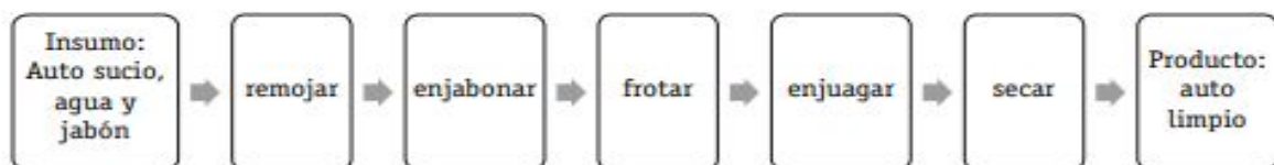
Diagrama de proceso