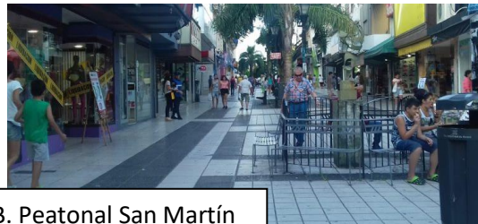
B. Peatonal San Martín