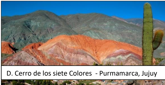
D. Cerro de los siete Colores - Purmamarca, Jujuy