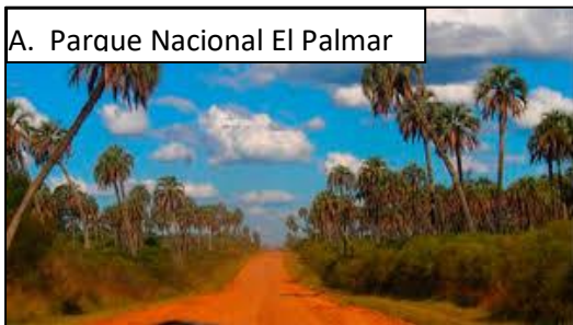
A. Parque Nacional El Palmar

2. Observa las imágenes y completa el cuadro