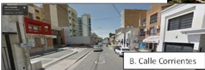
B. Calle Corrientes